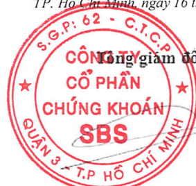
DƯƠNG MẠNH HÙNG